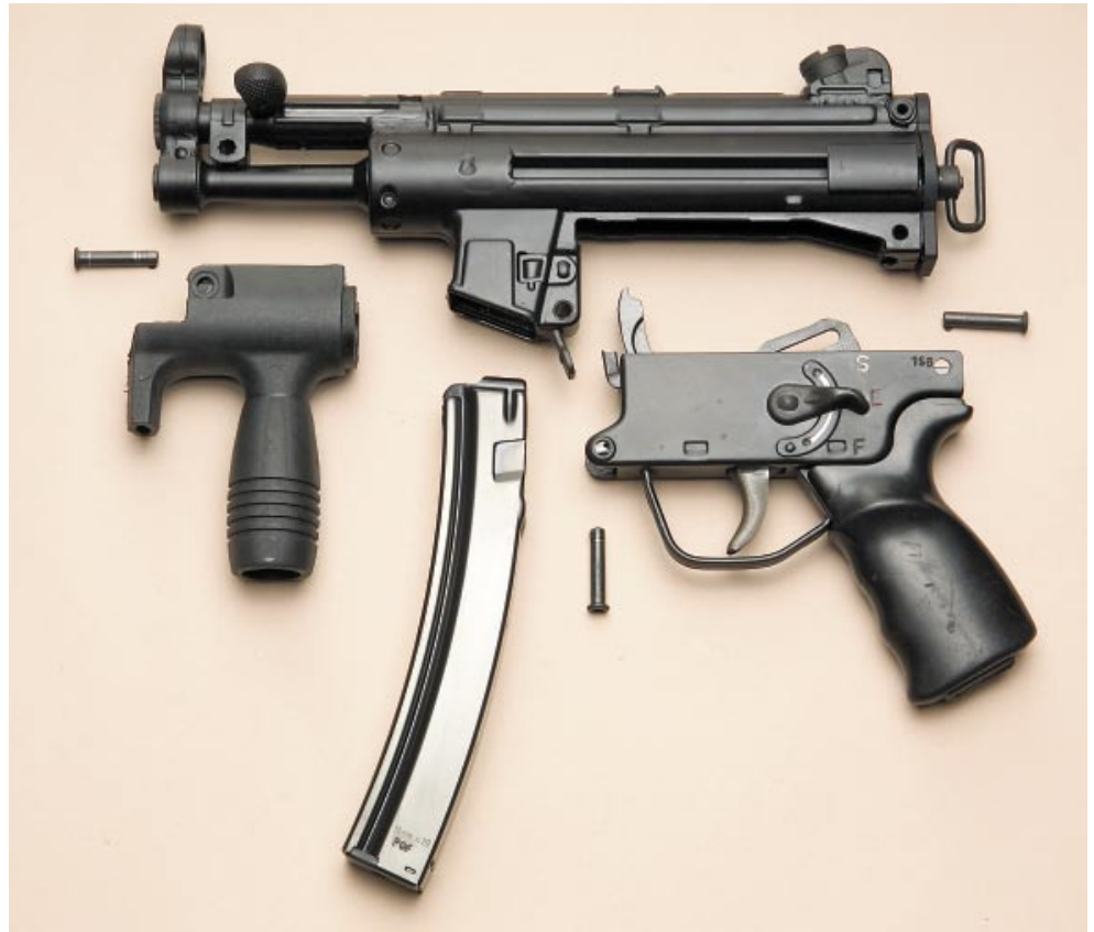
Teilesatz. Zerlegt offenbart sich, wie kurz das Stummelläufchen tatsächlich ist. Wird ein Vorderschaft ohne Handgriff verwendet, ist die Waffe sogar zum sportlichen Schießen zugelassen.

Besondere Lösungen. Ebenso wurde das Gehäuse im Bereich der Bodenstückaufnahme mit zwei Verstärkungsblechen unterstützt, um die größeren Vibrationen beim Schuss ausgleichen zu können. Zudem wurde auch die Visierung verändert. Während alle Versionen der MP5 über eine Dioptertrommel verfügen, deren unterschiedliche Größen