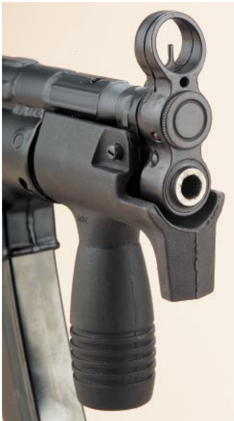
Mündungsansicht. Die Nase des Vorderschafts schützt die Finger der Führhand.