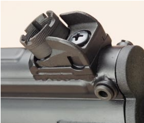
Keine Lochkimme: Im Gegensatz zur normalen MP5 hat die MP5k offene Kimmenausschnitte.