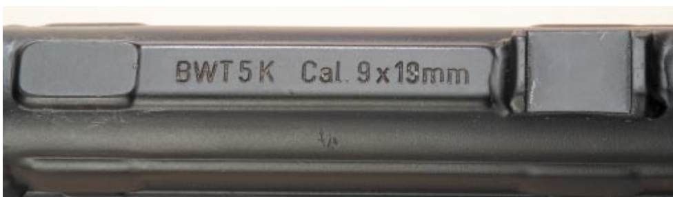
Systemoberseits. Gehäuse mit Modellbezeichnung und Kaliber. Letzteres heißt zwar korrekt 9 mm x 19, aber das versteht trotzdem jeder. Ebenfalls zu sehen die Montagefüße für Zieloptiken.

Außendimensionen der Waffe erheblich zu beeinträchtigen, konnte so nun endlich auch im Schulteranschlag geschossen werden, wodurch sich der Einsatzbereich nahezu auf 50 m verdoppelte und die Wahrscheinlichkeit präziser Treffer erheblich verbessert werden konnte.