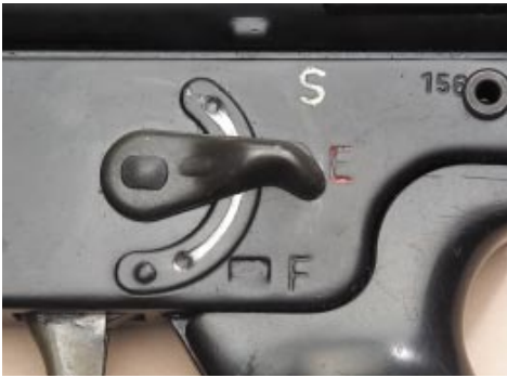
Angetäuscht: Die Dauerfeuerstellung ist noch vorhanden, aber funktionslos.